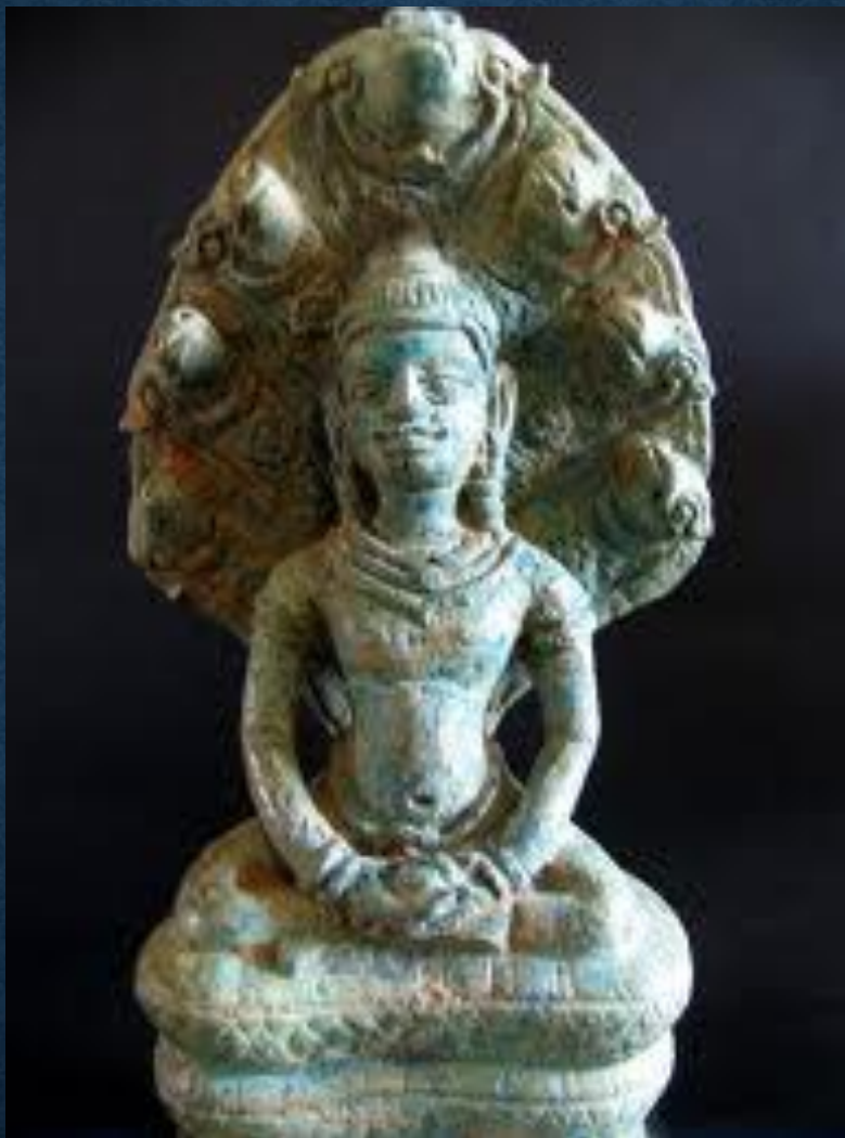
พระโกษัศยคุรุไวฑูรยประภา