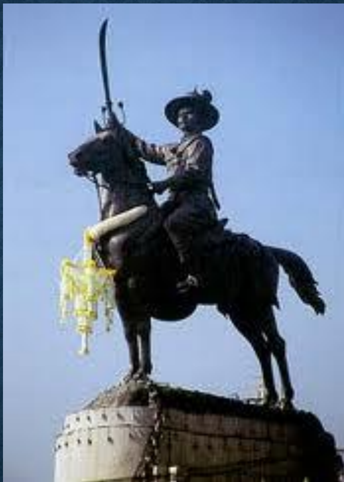
พระบาทสมเด็จพระเจ้าตากสินมหาราช